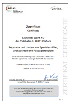
Zertifizierungsurkunde Elsflether Werft AG

Mehrere Mitarbeiter der Elsflether Werft AG wurden erfolgreich in Form einer Inhouse-Weiterbildung zum Energiebeauftragten geschult und sorgen für eine breite Energiesparkommunikation in den einzelnen Abteilungen. Steuererstattungsmechanismen (Strom- und Energiesteuer) wurden beleuchtet und Förderungen für das Energiemanagement bei der BAFA beantragt. Auf Grundlage bestehender Energielieferverträge wurden Empfehlungen für die Optimierung für den Energieeinkauf ausgesprochen.